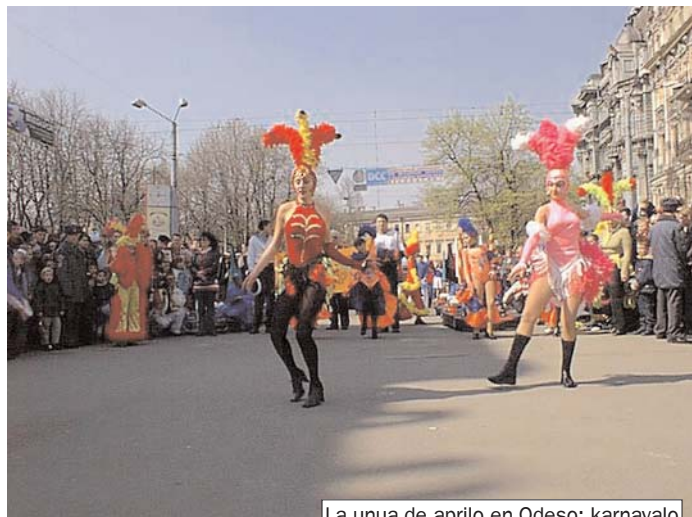
La unua de aprilo en Odeso: karnavalo

(Ĉiuj prenas grandan afiŝon "ODESO-KOVROV", kaj, montrante ĝin al publiko, "la tramo" forveturas.)