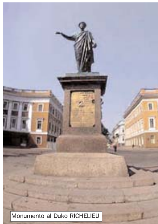
Monumento al Duko RICHELIEU

- Ĉu tridek hrivnoj por tiu bonegaĵo ne estas senpage?!