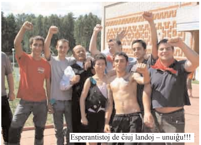
Esperantistoj de ĉiuj landoj – unuiĝu!!!

Komence, duono de mia mono iris al banditoj, kiuj devigis min pagi tion al ili. Mi do decidis iri aliloken kaj iris al la ruĝa placo. Mi donis iom da mono al la gardantoj kaj povis trankvile labori. Iom post iom mi